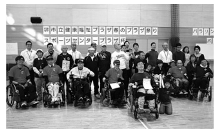
春のプラザ祭り ボッチャ大会 集合写真

「4月に行った“春のプラザ祭り”に初めて参加して楽しかった」「スタッフの対応がよくうれしかった」というご意見を頂戴しました。イベントに携わった職員として、うれしい限りです。これからも皆さまに喜んでいただけるプラザでありたいと思います。職員の励みとなるご意見、本当にありがとうございました。